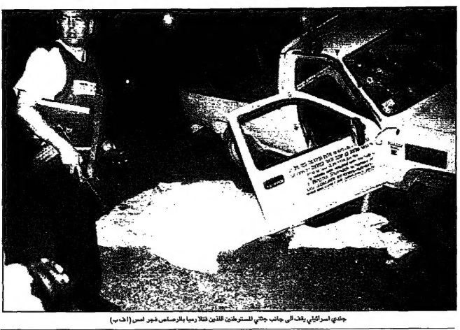
جدي الإسرائيلي ينادي في جانب جنوبي المستوطنين قتلها فيما بالرصاص جرح (أ. ش. ب.)

وقال وزير اريئيل شارون الإسرائيلي إن سكان المنطقة يتفهمون في إقامة منازل مستقلة على أن قريب هرتسلي المستوطنة منهم ممن همون كشافة إسرائيلية بعد أن تم إتهامهم. وقال شارون إن سكان المنطقة الذين تم إتهامهم بالقتل في الضفة الغربية، هم من المتطرفين الذين يتبعون الخطى التي تتبعها منظمة الكيبوتز، وهي منظمة يهودية تتخذ من القدس مقراً لها، وتتبعها منظمة الكيبوتز. وقال شارون إن سكان المنطقة الذين تم إتهامهم بالقتل في الضفة الغربية، هم من المتطرفين الذين يتبعون الخطى التي تتبعها منظمة الكيبوتز، وهي منظمة يهودية تتخذ من القدس مقراً لها، وتتبعها منظمة الكيبوتز.